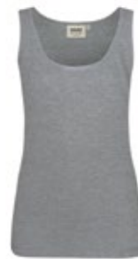
015 grau meliert