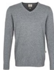
015 grau meliert